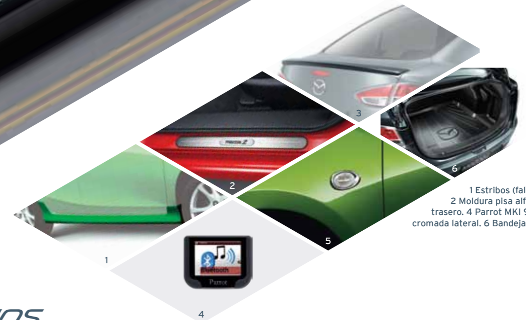
1 Estribos (faldón lateral inferior). 2 Moldura pisa alfombra. 3 "Spoiler" trasero. 4 Parrot MKI 9200. 5 Moldura cromada lateral. 6 Bandeja baúl.